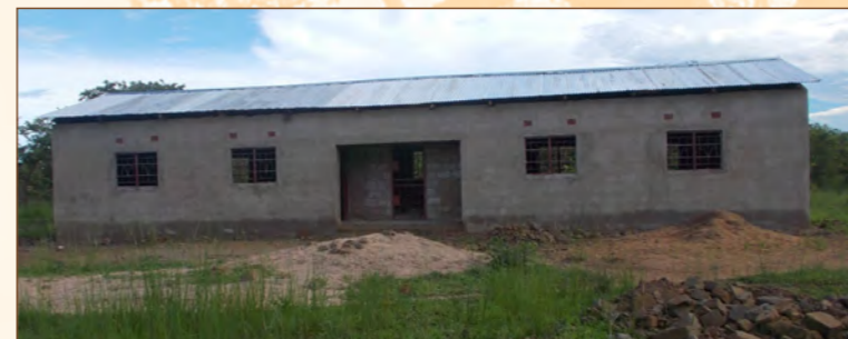
Janvier 2015 - Finitions en cours

Un puits a été creusé grâce à la Fondation Roi Baudouin. Il approvisionne aussi en eau la population de 3 villages en même temps que l'école.