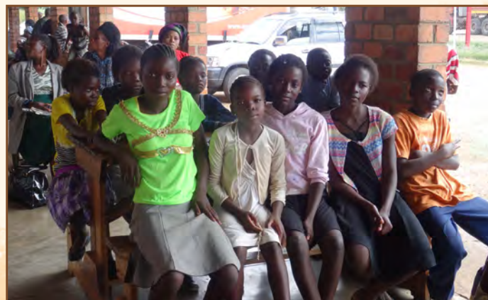
Etudiants attendant leur parrainage

Pour plusieurs de ces filles (trop jeunes mères) il a été possible de les repêcher quand l'enfant peut être éduqué par la grand-mère, mais le cycle des 3 ans d'études est souvent perturbé et à recommencer.